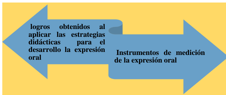
Figura 2 Ejes temáticos

Los datos se realizaron en la matriz de consistencia (ver Anexo 3)